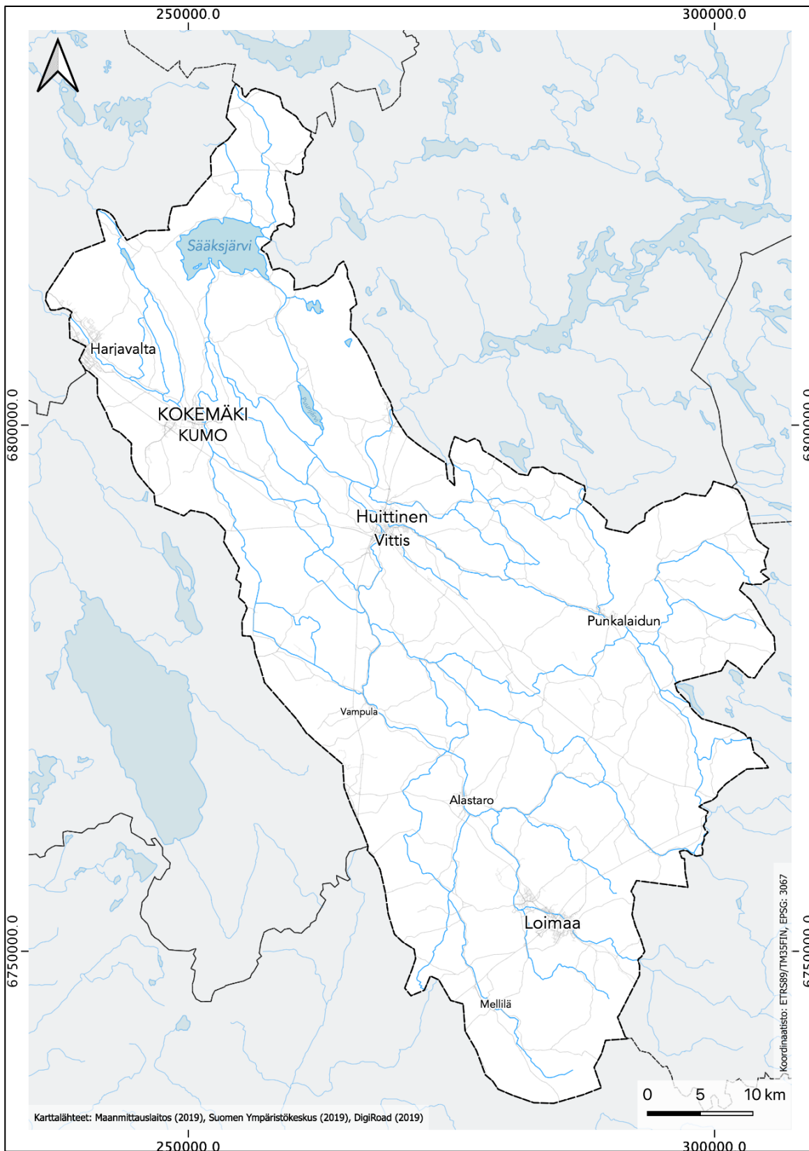
Kuva I. Kokemäen kalatalousalueen kartta.