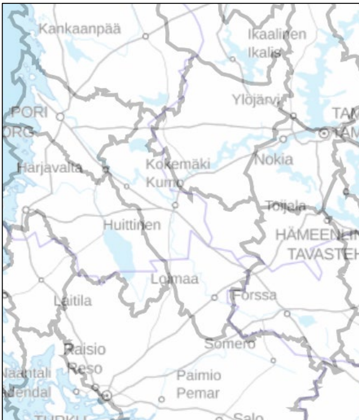
Kuva 3. Kokemäen kalatalousalueen (keskellä) naapurikalatalousalueet ovat Lounais-Suomen, Eurajoki-Lapinjoen, Porin, Karvianjoen, Kokemäenjoen yläosan, Pirkkalan ja Tammelan-Tarpianjoen kalatalousalueet.

Lisäksi kalatalousalueen on tärkeää olla mukana eri yhteistyöryhmissä. Usein yhteistyöryhmissä aluetta edustaa toiminnanjohtaja tai puheenjohtaja, mutta hallituksen ja kalatalousalueen jäsenten paikallistuntemus ja asiantuntemus kannattaa huomioida henkilövalinnoissa. Aluetta voi edustaa niin sovittaessa myös hallituksen ulkopuolinen henkilö. Alueellisessa edunvalvonnassa tehdään yhteistyötä naapurikalatalousalueiden kanssa (kuva 4). Kalatalousalueen jäseniä (vesialueen omistajat ja valtakunnalliset kalastusalan järjestöt) voidaan avustaa lausuntojen antamisessa tai antaa yhteisiä lausuntoja.